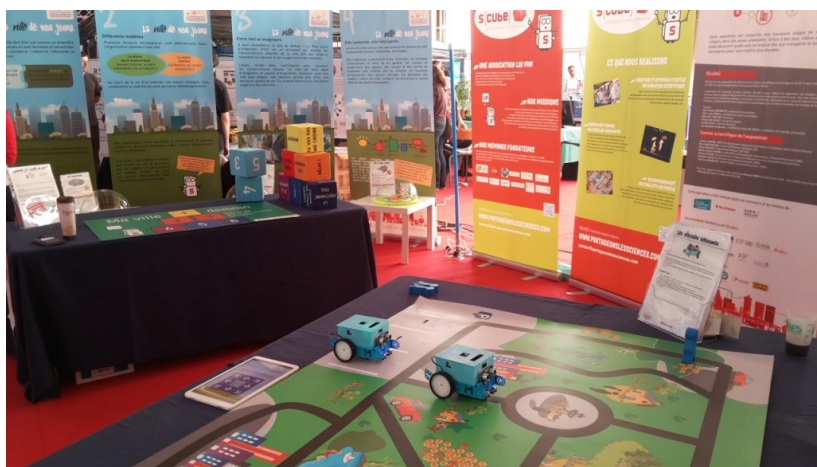
Réseaupolis de S[cube] à la Fête de la science 2016

La Communauté Paris-Saclay a pour objectif de soutenir la création d'espaces de rencontre et d'échange entre chercheurs et habitants du territoire afin de favoriser la transmission des connaissances dans une approche ludique et conviviale.